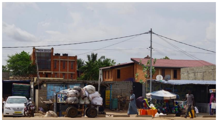
So sieht man das Gebäude von der der Straße aus.