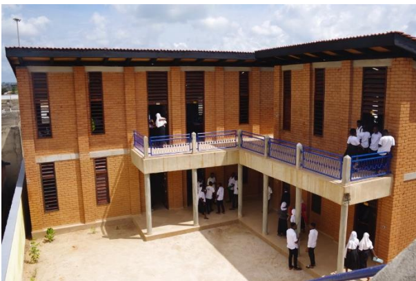
Hier, auf dem alten Gelände der Grundschule sind jetzt die 6 Klassen des Gymnasiums zu Hause.

In Zongo konnten zum Schuljahresbeginn Mitte September alle neuen Gebäude bezogen werden. Durch die Trennung der drei Schultypen mit ihren unterschiedlichen Pausen- und Unterrichtszeiten gibt es jetzt deutlich weniger Unruhe auf dem Schulgelände. Am 28. Oktober 2023 wurden am Tag der offenen Tür die neuen Gebäude eingeweiht. Neben den Mitgliedern der Schulgemeinschaft, den Amtsträgern aus Zongo, fast allen Vorstandmitgliedern von Mon Devoir e.V. und einer großen Besuchergruppe aus Deutschland waren nach langer Zeit auch wieder Vertreter des Ministeriums anwesend. Die Austauschschüler aus Stuttgart stellten gemeinsam mit einer Abiturklasse von Mon Devoir ihre Projektarbeit vor: „Ein touristischer Rundgang durch Zongo“. Noch nicht gebaut werden konnten bisher ein Regendach über dem neuen, großen Pausenhof und die beiden Räume für die Direktion im Neubau des Gymnasiums.