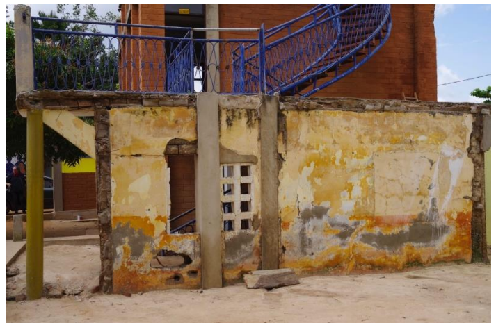
Die alte Mauer an der Seite des Computerraums ist alles, was von den ursprünglichen Gebäuden noch übriggeblieben ist. - Mal sehen, was daraus noch wird! Eine Fläche für kreative Köpfe.